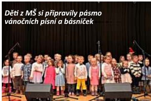
Děti z MŠ si připravily pásmo vánočních písní a básniček